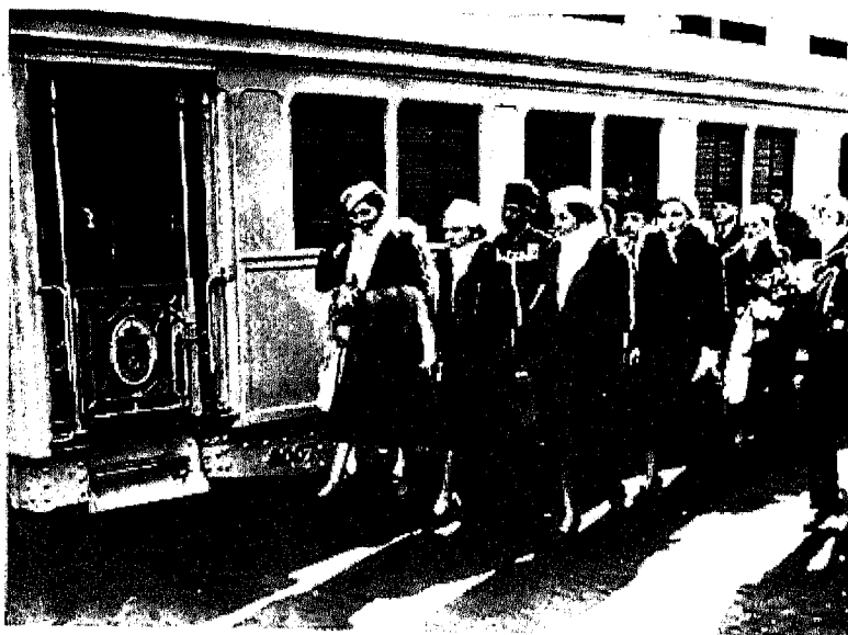
القطار الملكي . . وفي الصورة الملكة نازلي والأميرة فوزية قبل زواجها والأميرة فائزة بزي الخروج الرسمي تصحبهن الوصيفات وحرس الشرف .